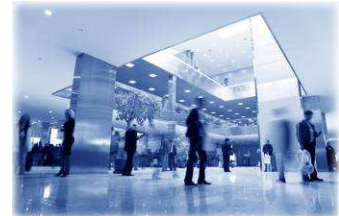
Autres: Parcs de loisirs, Administrations, Commerces de proximité, Autoroutes et parkings...