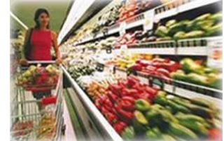
Grande Distribution Grands Magasins