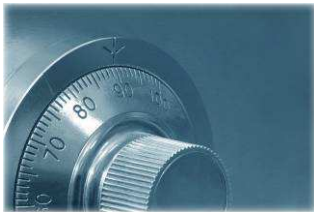
Transports de fonds