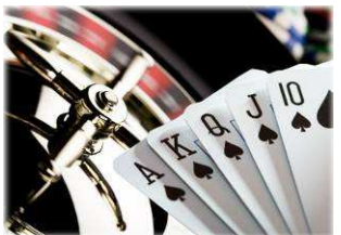
Casinos de jeux